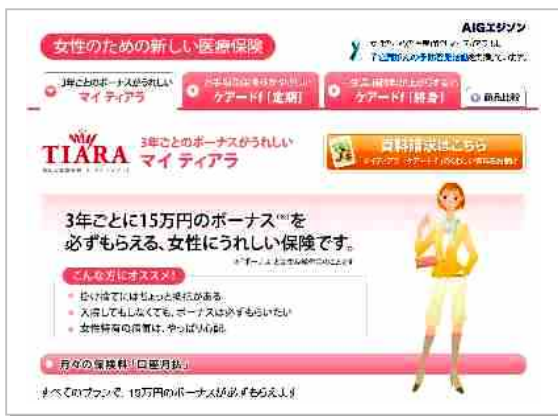
【「マイ ティアラ」基本画面】

また「各種給付対象となる女性の病気」や様々な用語についても、簡単な言葉で説明をし、従来分かりづらかった「医療保険」を丁寧に解説しました。